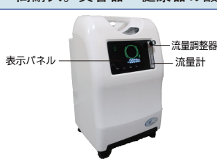
※医療機器としての使用はできません

流量の異なる2タイプをご用意（5L、10L）。 オイルフリーコンプレッサーを使用しているため、低騒音、高耐久。美容器・健康器の酸素供給源やペット関連のご利用に。